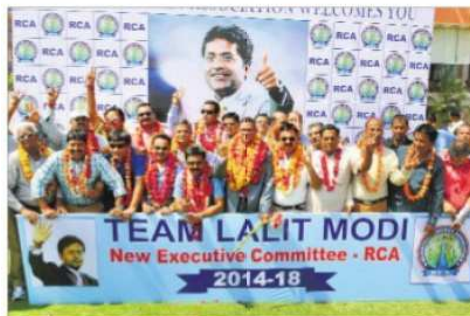
The new executive body of Rajasthan Cricket Association poses for a photograph after they won RCA elections on Tuesday.