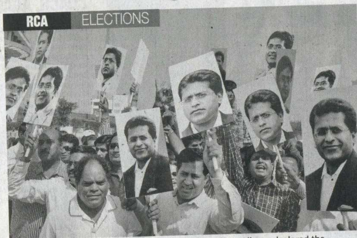
Supporters celebrate in Jaipur on Tuesday, after Lalit Modi was declared the Rajasthan Cricket Association president.

"The BCCI president and secretary cannot take the decision arbitrarily. They should have followed the due process of calling a special general meeting to