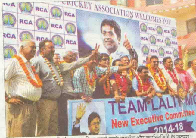
मोदी की जीत के बाद आरसीए के बाहर खुशियां मनाते उनके समर्थक और कार्यकारिणी के सदस्य।