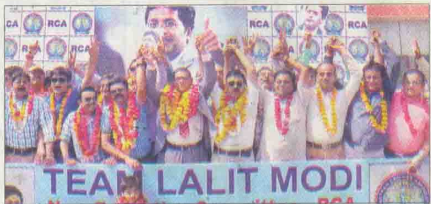
आरसीए में ललित मोदी की नई कार्यकारी में चुने गए सदस्य विजयी मुद्रा में और सदस्यता किल्लित करने के विरोध में बीसीसीआई सेक्रेटरी का पुतला जलाते लोग।