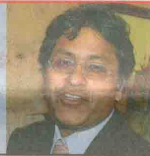
LALIT MODI ON TWITTER

day to the RCA informed the body of the suspension under Rule 32 (VII) of its constitution. Although initially caught off-guard by the speedy BCCI action, the newly-elected executive committee of the RCA regrouped by evening to declare that they will not go down without a fight. “We will approach the appropriate court