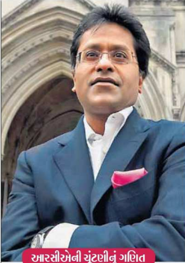
આરસીએની ચૂંટણીનું ગણિત

આઈપીએલ ટુવેન્ટી20 લીગના ભૂતપૂર્વ કમિશનર લલિત મોદી રાજસ્થાન ક્રિકેટ એસોસિયેશન (આરસીએ)ના પ્રમુખ જાહેર કરવામાં આવ્યા છે અને વિવાદોથી ઘેરાયેલા મોદીએ આરસીએની ચૂંટણીને એકતરફી રીતે જીતી લીધી હતી. સુપ્રીમ કોર્ટના આદેશ બાદ મંગળવારે સવારે 10:00 વાગ્યે મુખ્ય ઓબ્ઝર્વર એન. એમ. કાસલીવાલે પરિણામ જાહેર કર્યું હતું. મોદીના પ્રમુખ બન્યાના એક કલાક બાદ બીસીસીઆઈએ આરસીએને અનિશ્ચિત મુદત સુધી સસ્પેન્ડ કરી દીધું છે. ચૂંટણી છેલ્લા વર્ષની 19મી ડિસેમ્બરે થઈ હતી પરંતુ સુપ્રીમ કોર્ટમાં તેને પડકારમાં આવી હોવાના કારણે પરિણામ હજુ સુધી જાહેર કરવામાં આવ્યું નહોતું.