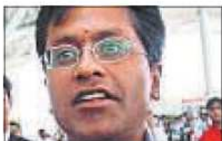
■ Lalit Modi